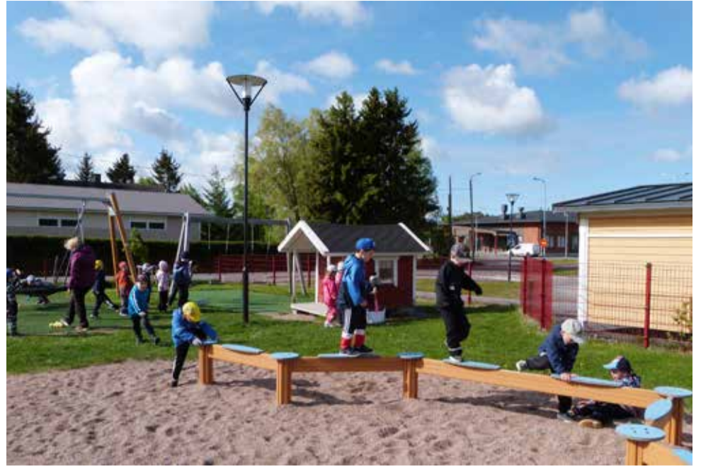
Supersankari-lapset kiertävät tempurataa vauhdikkaasti Ylihärman päiväkodin pihassa.

– Kielitaitoni on kehittynyt paljon, kun asioidessa on pakko käyttää englantia. Viihdyn hyvin Suomessa ja työpaikassa-