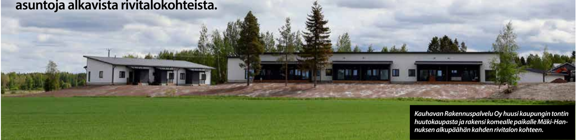
Kauhavan Rakennuspalvelu Oy huusi kaupungin tontin huutokaupasta ja rakensi komealle paikalle Mäki-Hannuksen alkupäähän kahden rivitalon kohteen.

Rivitaloasuntojen kysyntä on kasvanut Kauhavalla. Tukeakseen kaupungin asuntotuotantoa Kauhavan Vuokra-asunnot Oy ostaa asuntoja alkavista rivitalokohteista.