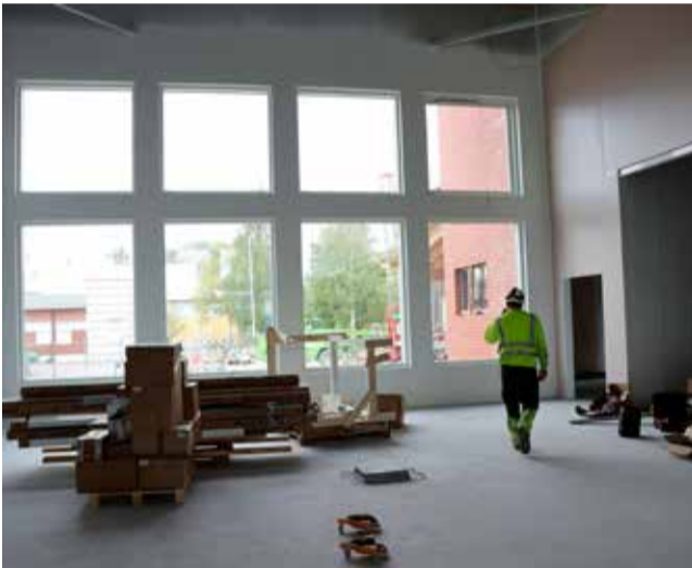
Ruokalassa on avaraa ja valoisa. Koululaiset ja opettajat astuvat uuden koulun ovista tammikuussa 2024.

– Väriin mukaan on helppo ohjata oikealle sisäänkäynnille. Yläkoulun puolella on käytetty