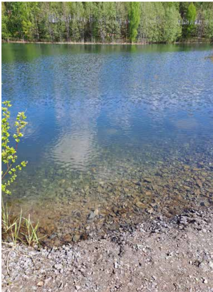
Hiekkakuoppa on enimmillään viisi metriä syvä. Vesi on erittäin kirkasta. Rinneet ovat jyrkkiä, korkeuseroa maastossa on 9 metriä. Vastarannan yläpuolella voi nähdä Härmäntien liikennettä.

Virkistysalueelle on helppo tulla. Parkkipaikka 30 autolle tulee Tuomistentien varrelle. Siitä on lyhyt kävelymatka uimarannalle. Tosin korkeuseroa maastossa on enimmillään jopa