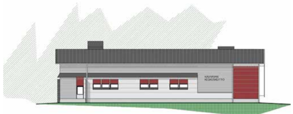
Kauhavan keskuskeittiön julkisivu Härmäntien suuntaan/Suunnittelutalo PPG Oy/Päivi Ihamäki

Palvelukeittiöt toimivat Alahärmän koulukeskuksessa ja Metsäkulman päiväkodissa, Ylihärmän koulukeskuksessa ja päiväkodissa, Kauhavan koulu-