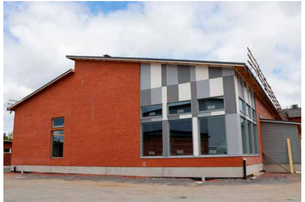
Alahärmään valmistuvaan koulukampukseen tulee tilat myös kirjastolle.

Alahärmän kampuksen erityispiirteenä on se, että tiloja löytyy myös toiminta-alueittain