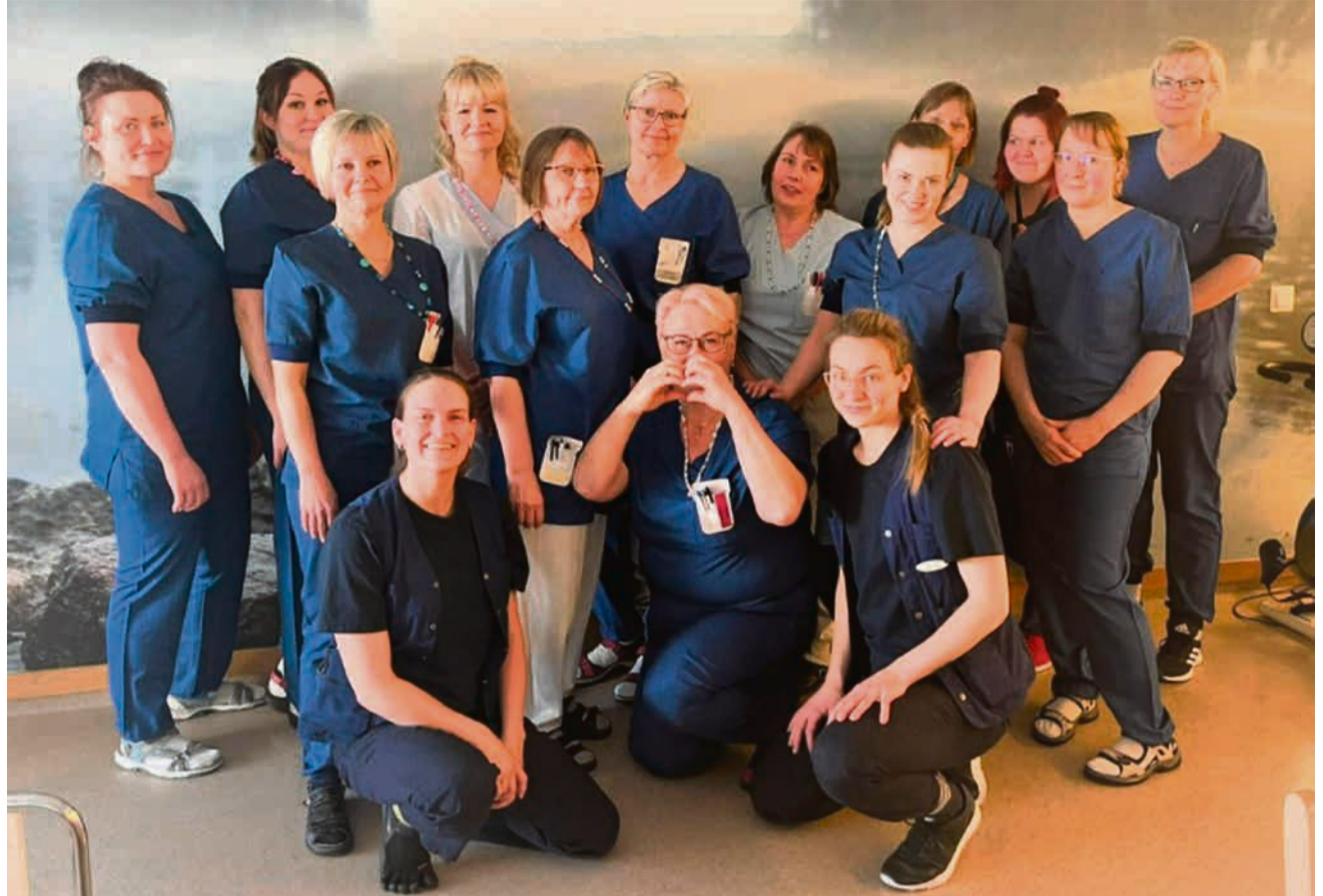
Rekrytoinnin kuvassa poseeraavat Kuntayhtymä Kaksineuvoisen rautaiset ammattilaiset kutsuvat uusia työkavereita työyhteisönsä.

Meillä on jatkuvasti avoimia toimia, jotka löytyvät kuntarekry.fi-sivustolta tai Kuntayhtymä Kaksineuvoisen verkkosivuilta: kaksineuvoinen.fi/rekrytointi.