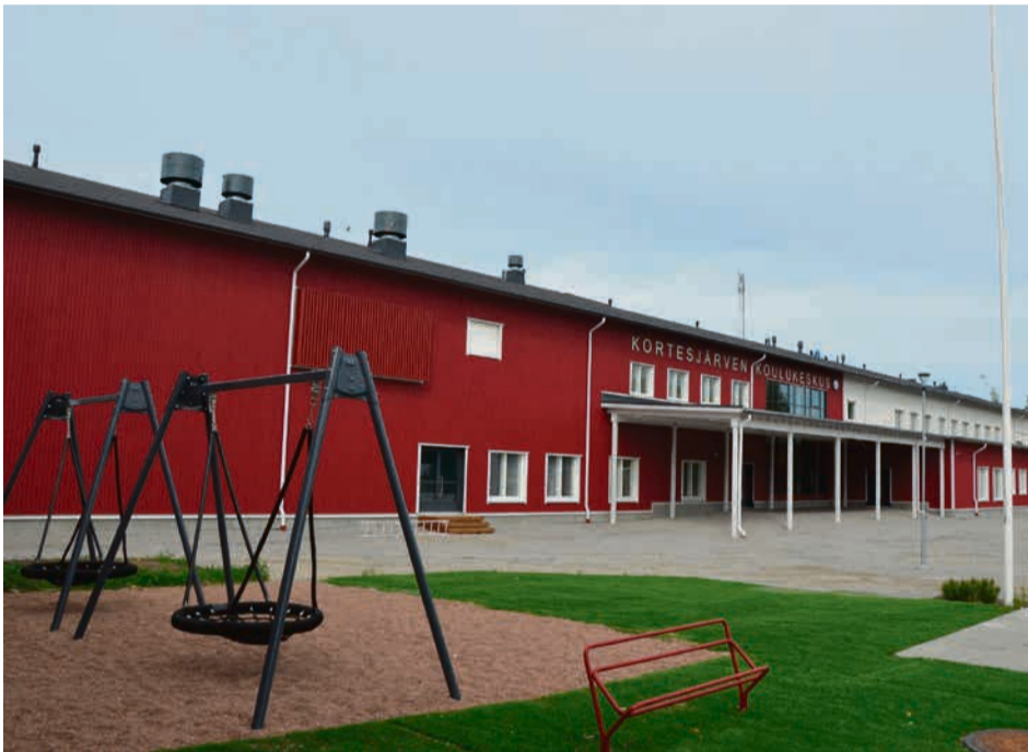
Arkitehtitoimisto Motiivin suunnittelema Korttesjärven uusi koulu on monikäyttöinen ja moderni.

– Korttesjärven koululla käydessä kerroksessa on alakoulun loput opetustilat. Yläkoulun opetustilat sijaitsevat ensimmäisessä kerroksessa, jossa ovat myös ruokala ja liikuntasali.