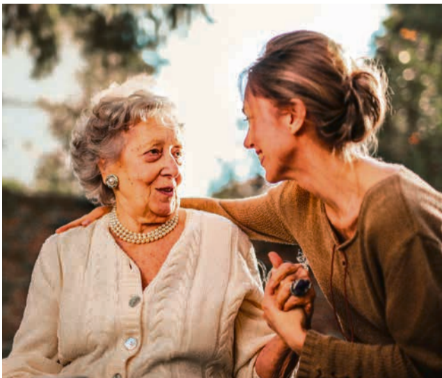
Kiertävät perhehoitajat tukevat kotona asumista. Kuvituskuva.

Kiertävällä perhehoitajalla tulee olla auto käytettävissä, että hän pääsee liikkumaan asiakkai-