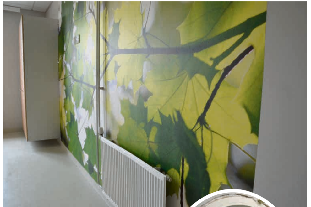
Luonto tulee lähelle potilashuoneessa.