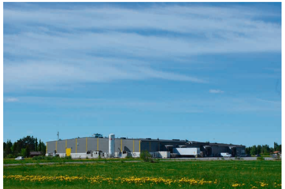
Atrian omistama Domretor on elintarvikkeiden ja puolivalmisteiden sopimusvalmistaja.