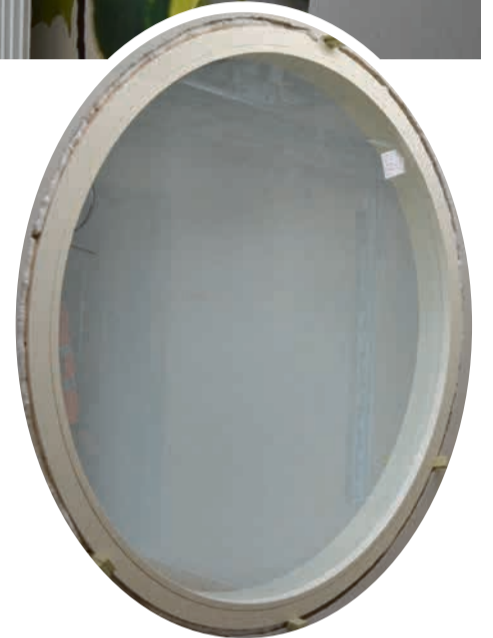
Pyöreät ikkunat ovat C-osan hammashoitolan tunnusmerkki. Koko rakennuksessa on kiinnitetty huomiota luonnonvaloon.

Kauhavan hyvinvointikeskuksessa yhdistyvät sosiaali- ja terveydenhuollon toiminnot moderniksi kokonaisuudeksi. Tilat valmistuvat aikataulun mukaisesti syksyyn mennessä.