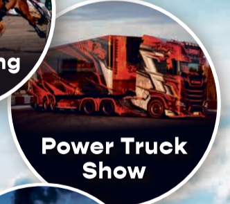
Power Truck Show