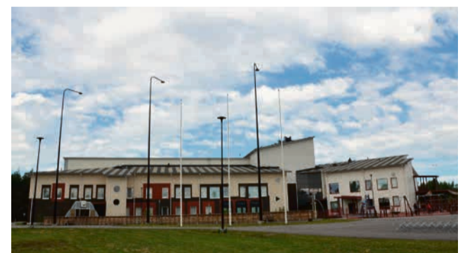
Kauhavan koulukeskus oli ensimmäinen Kauhavan isoista kouluhankkeista.

– Moduuli on hankittu viidessä vuodessa, ja sille on kaksi kahden vuoden optiota.