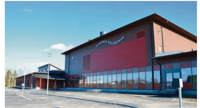
Ylihärän uusi alakoulu on otettu käyttöön tänä keväänä.

– Nuorille varattu alue on rajattu niin, että ovet muuhun osaan koulua ovat iltaisin lukittuna.