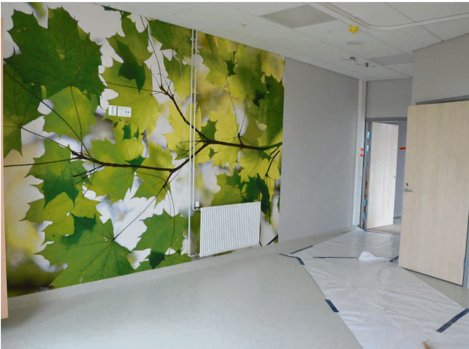
A-osan toisessa kerroksessa sijaitsee osasto, jonka jokaisessa potilashuoneessa on oma kylpyhuone ja vessa. Raikkaita luontoaiheisia tapetteja on eri puolilla taloa.