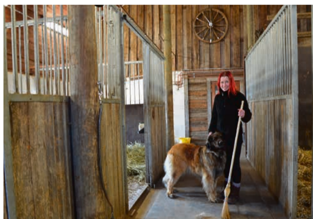
Hevosille on vuokra paikkoja sekä pihatossa että tallissa.