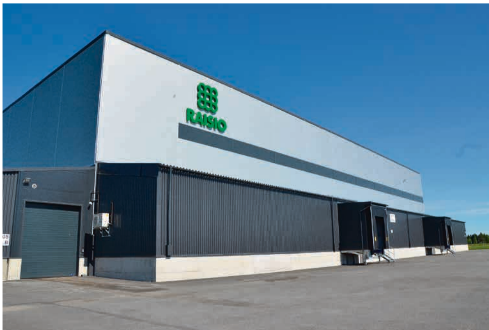
Raision tehtaalla valmistetaan Beanit-härkäpapatuotetta ja Härkis alihankintana Domretorilla.