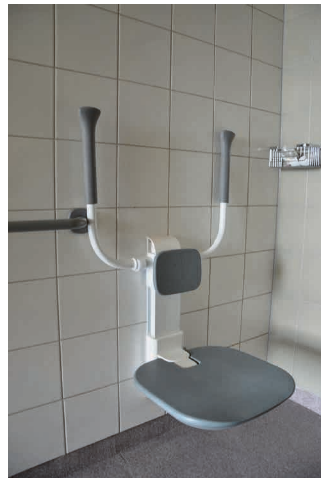
Jokaisessa potilashuoneessa on oma pesuhuone ja wc.