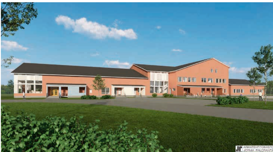
Alahärän koulun havainnekuva. Yksityiskohtia hiotaan, mutta rakentaminen alkaa tänä kesänä.

varattu tilat hammashoitotalle. Tiloja on suunniteltu yhteistyössä Kuntayhtymä Kaksineuvoisen kanssa.