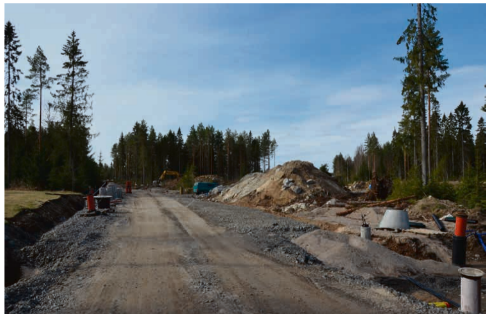
Kantolaan rakennetaan kunnallistekniikkaa. Alueelle on kaavoitettu 30 omakotitalotonttia.

– Teemme muun muassa Ylihärmän koulukeskuksen tiejärjestelyt ja urheilualueen, Järventien kevyen liikenteen väylän 600 metrin osuuden, Pukkilaraitin entisen kaupungintalon takana sekä yhdystien teollisuusalueelle, Rajala luettelee.