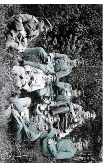
I proportion till befolkningen värvades flest jägare från södra Osterbotten, i synnerhet från nuvarande Kauhava stads område.

Det nyrenoverade museet har som målsättning att lättillgängligt kunna erbjuda mångsidiga museiupplevelser. Museet har även en liten shop samt ett café öppet på beställning.